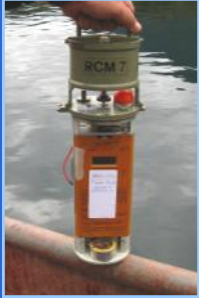
Estudios de corrientes, olas y mareas