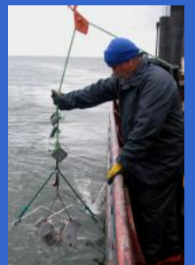
Estudios de la columna de agua y del fondo marino

Damos soluciones efectivas e innovadoras, aplicando nuevas tecnologías, en las distintas áreas del rubro marítimo