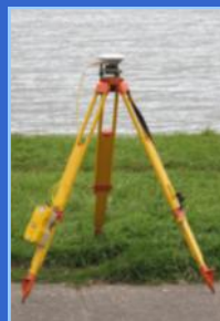
Geodesia y topografía costera

Nuestra misión es dar un servicio de excelencia en las áreas de ingeniería marítima, naval y submarina