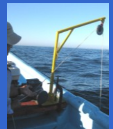
Estudios de la columna de agua y del fondo marino

Damos soluciones efectivas e innovadoras en el área ambiental para proyectos marítimos